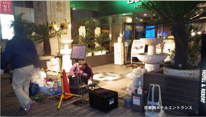
首都圏ホテルエントランス