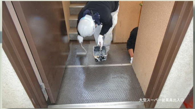
大型スーパー従業員出入口