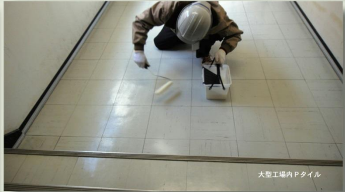
大型工場内Pタイル